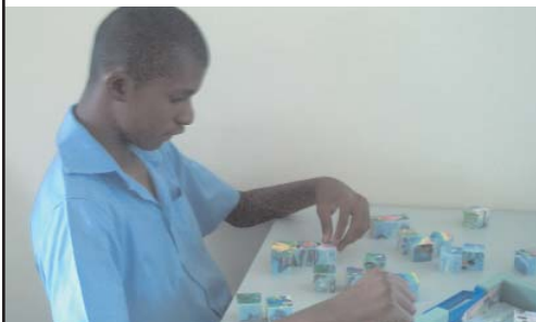
Un travail structuré