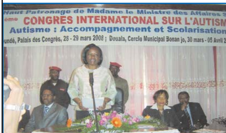
Le MINAS ouvre le congrès en 2008