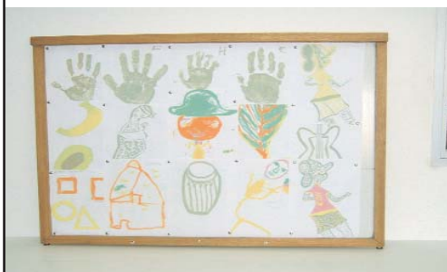
Travail artistique des enfants