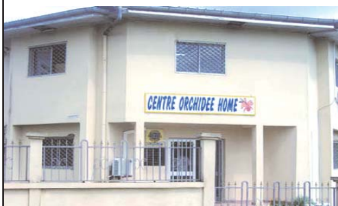
Une vue du COH