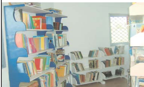
Une vue de la bibliothèque

Le Centre Orchidée Home est une structure spécialisée proposant une prise en charge éducative spécifique à l'autisme, avec l'utilisation de l'approche ABA (analyse appliquée du comportement) en particulier, en vue d'une intégration scolaire en milieu ordinaire.