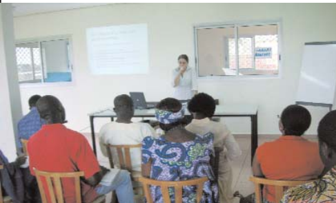
Seminaire de formation

Une guidance parentale a pour but de soutenir les familles. Le professionnel doit rester à l'écoute des parents. Il les aide à comprendre les difficultés rencontrées au quotidien. Parce que les parents constituent le premier maillon de la chaîne environnementale, ils sont les co-thérapeutes. Leur adhésion, leur implication dans le projet de prise en charge est essentielle et inconditionnelle pour les progrès de l'enfant. Pour y arriver les familles ont besoin d'une guidance parentale.