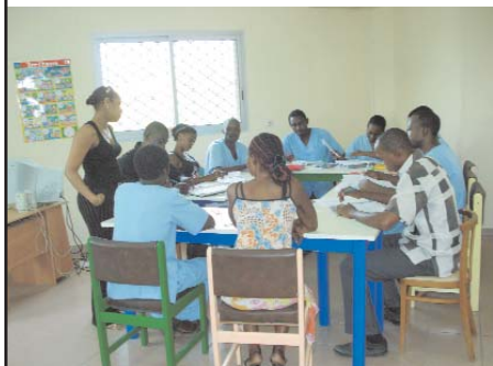
Formation théorique des éducateurs

- Etudier et envisager la meilleure prise en charge au coût le plus acceptable possible, afin de permettre à un plus grand nombre d'enfants d'accéder à une éducation adaptée.