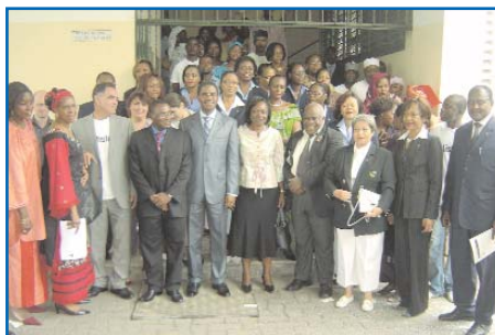
Le MINAS et le MINSANTE au congrès de l'Autisme en 2008