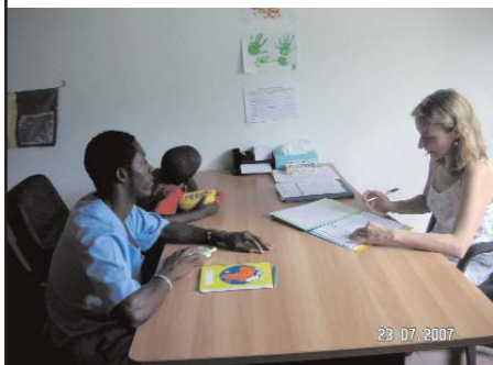
Supervision d'un éducateur