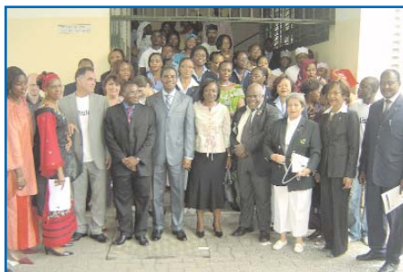
Le MINAS et le MINSANTE au congrès de l'Autisme en 2008