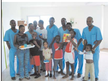
Equipe des éducateurs