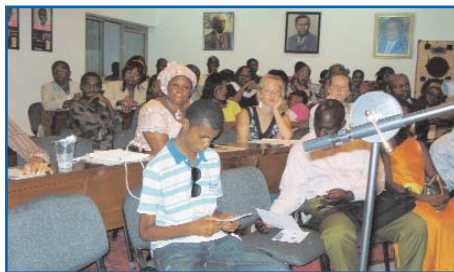
Vue du congrès en 2008