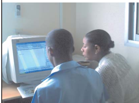
Suivi individualisé d'un enfant

- Regrouper l'information sur l'autisme en organisant les campagnes de sensibilisation envers les pouvoirs publics et le grand public (séminaires de formation et congrès).