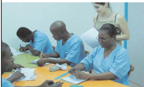
Evaluation des éducateurs

Le projet éducatif du Centre Orchidée est orienté selon deux axes :